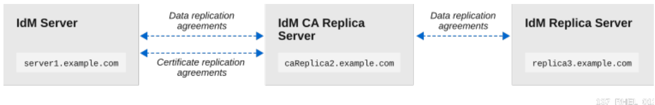
图 5.1. 本例中使用的复制拓扑